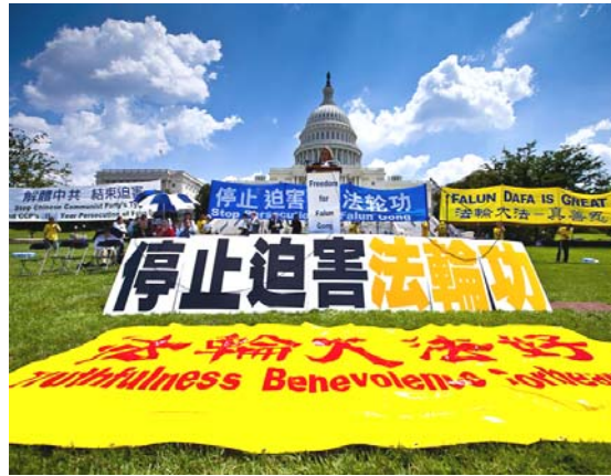
2010 年 7 月 22 日, 在美国首都华盛顿国会山庄西草坪上, 来自世界各地的三千多名法轮功学员举行了“七·二零”反迫害集会。

迫害法轮功的决定从一开始就在中央政治局常委内部引起争议。朱镕基、李瑞环认为, 对于一种“气功”完全没有必要大动干戈, 更没必要搞成巨大的运动。江