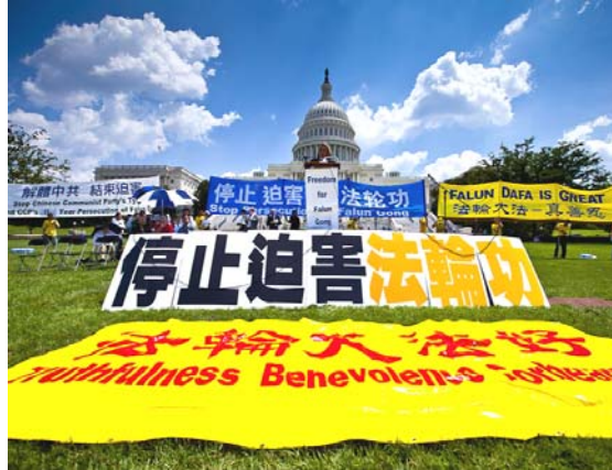
2010 年 7 月 22 日，在美国首都华盛顿国会山庄西草坪上，来自世界各地的三千多名法轮功学员举行了“七·二零”反迫害集会。

【明慧网】香港《前哨》杂志 2011 年 2 月刊大陆报导栏目中的头条文章，即总第 240 期被列为封面的精选文章，作者揭示了中共前党魁江泽民的自认告白，文章题目是《江泽民终生后悔的两大事件》。江泽民自知死期不远，2010 年起至少两次对身边的人谈到，这一辈子做过两件愚蠢之事：蠢事之一是美国轰炸南斯拉夫时，下令中国大使馆不能撤退；蠢事之二则是镇压法轮功。江泽民镇压法轮功，为自己平添了几千万“敌人”，这是他自己认为一辈子中所做的第二件大蠢事。