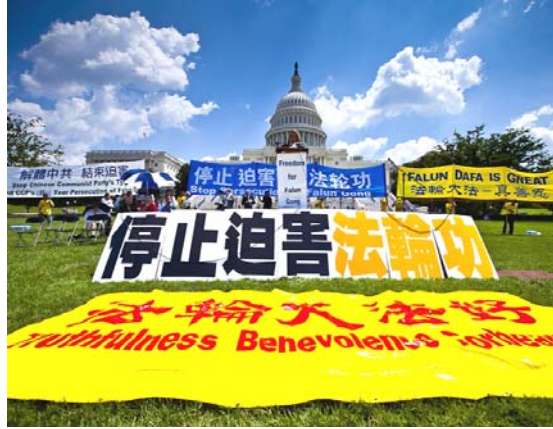
2010 年 7 月 22 日，在美国首都华盛顿国会山庄西草坪上，来自世界各地的三千多名法轮功学员举行了“七·二零”反迫害集会。

【明慧网】香港《前哨》杂志 2011 年 2 月刊大陆报导栏目中的头条文章，即总第 240 期被列为封面的精选文章，作者揭示了中共前党魁江泽民的自认告白，文章题目是《江泽民终生后悔的两大事件》。江泽民自知死期不远，2010 年起至少两次对身边的人谈到，这一辈子做过两件愚蠢之事：蠢事之一是美国轰炸南斯拉夫时，下令中国大使馆不能撤退；蠢事之二则是镇压法轮功。江泽民镇压法轮功，为自己平添了几千万“敌人”，这是他自己认为一辈子中所做的第二件大蠢事。