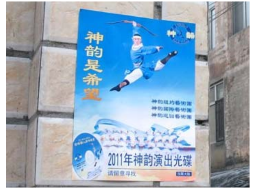
出现在大陆街头巷尾的神韵光盘海报