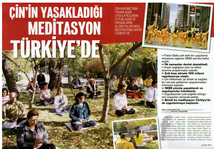
图：土耳其著名杂志《新当代》介绍法轮功以及中共对法轮功的残酷迫害