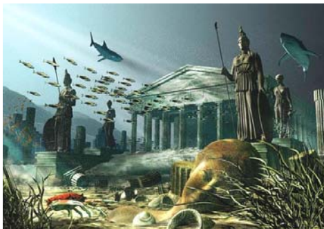
图：大西洲的故事，也是历史上惨痛教训的一页。 图为艺术家绘制的大西洲（亚特兰蒂斯）海底遗迹。