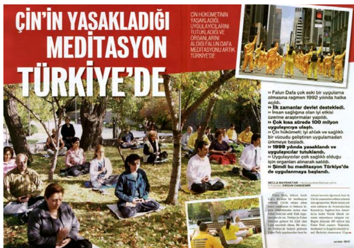
图：土耳其著名杂志《新当代》介绍法轮功以及中共对法轮功的残酷迫害

文章写道，由于中国大陆在短短七年的时间里学炼法轮功的人数达到了近亿人，远远超过了中共党员的人数，使得中共政权既恐惧又嫉妒，因此于一九九九年七月开始了对法轮功学员的血腥迫害。