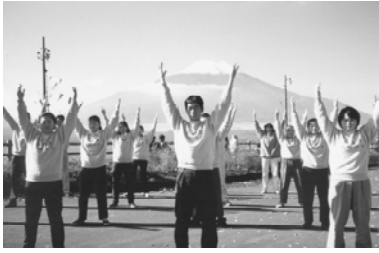
日本法轮功学员集体炼功

经历过浩劫后的灾民们，在最彷徨无助时，看到这班特殊的华人，似乎找到了希望，重拾回信心。临走时，工作人员一再表示感谢，并希望再次见到他们。◇