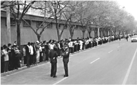
上访现场秩序井然，警察在一旁聊天

上访的法轮功学员自觉地站在人行道边给其他行人让出过道，他们没有口号，没有标语，安静祥和，秩序井然。当天朱镕基总理与法