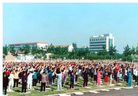
历史图片：1998年秋，山东潍坊市奎文区2000多人在白浪河畔的体育场炼法轮功。

◆《羊城晚报》1998年11月10日登载一则摄影报导，题目是《老少皆练法轮功》。该文称8日早上，广东省体委武术协会有关领导到广州烈士陵园等处，观看了5000名法轮功爱好者的大型晨练活动。体委的同志现场询问了几位法轮功的受益者，他们的修炼故事非常感人，其中有一位“原患高位瘫痪，全身70%部位麻木失灵，大小便失禁”，现见她“红光满面，练功的动作灵活自如”。该报导配发了93岁老人和2岁小孩练法轮功的照片，并介绍说，目前广东有近25万人修炼法轮功，法轮功强调传功不收费，义务教功……◇