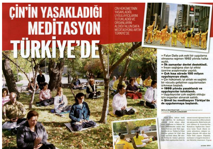
图：土耳其著名杂志《新当代》介绍法轮功以及中共对法轮功的残酷迫害