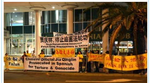
图：法轮功学员在珀斯喜来登酒店对面抗议贾庆林迫害法轮功

贾庆林是被“追查迫害法轮功国际组织”追查的十一个直接参与推动对法轮功学员迫害的中共中央官员之一，也是西班牙国家法庭以“群体灭绝罪”及“酷刑罪”起诉的五名迫害法轮功的元凶之一。