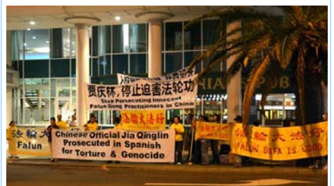
图：法轮功学员在珀斯喜来登酒店对面抗议贾庆林迫害法轮功

贾庆林是被“追查迫害法轮功国际组织”追查的十一个直接参与推动对法轮功学员迫害的中共中央官员之一，也是西班牙国家法庭以“群体灭绝罪”及“酷刑罪”起诉的五名迫害法轮功的元凶之一。