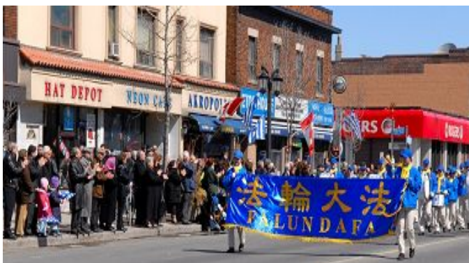
三月二十七日, 多伦多天国乐团首次参加“希腊独立日”庆祝游行获热烈欢迎

【明慧网二零一一年三月二十九日】二零一一年三月二十七日, 多伦多一年一度的“希腊独立日”