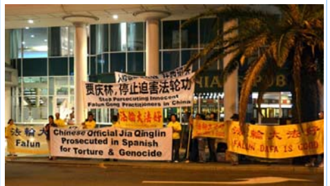
图：法轮功学员在珀斯喜来登酒店对面抗议贾庆林迫害法轮功

贾庆林是被“追查迫害法轮功国际组织”追查的十一个直接参与推动对法轮功学员迫害的中共中央官员之一，也是西班牙国家法庭以“群体灭绝罪”及“酷刑罪”起诉的五名迫害法轮功的元凶之一。