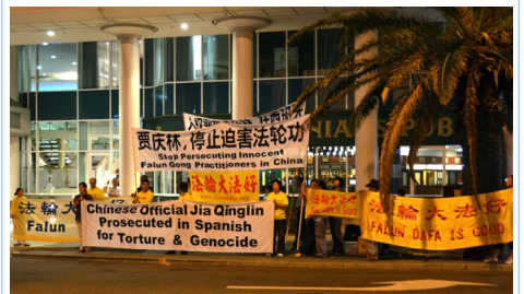
图：法轮功学员在珀斯喜来登酒店对面抗议贾庆林迫害法轮功

贾庆林是被“追查迫害法轮功国际组织”追查的十一个直接参与推动对法轮功学员迫害的中共中央官员之一，也是西班牙国家法庭以“群体灭绝罪”及“酷刑罪”起诉的五名迫害法轮功的元凶之一。