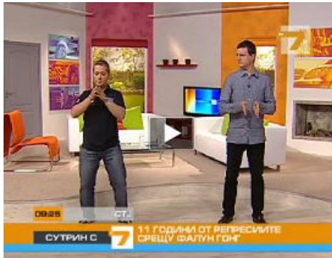
■ 保加利亚西人法轮功学员（左）为主持人和观众演示功法

二零一零年七月二十日，在法轮功学员反迫害十一周年之际，保加利亚国家电视7台的晨间节目，特邀两位西人法轮功学员在节目中介绍法轮功。学员在现场直播的节目中，为主持人和观众示范功法，并呼吁制止中共迫害。