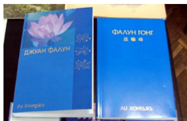
■ 保加利亚文《转法轮》和《法轮功》

二零零五年五月二十八、二十九日，保加利亚最大的图书展在首都索菲亚的国家文化宫（The National Palace of Culture）举行，法轮功学员带着保加利亚文《转法轮》参加了该次图书展。《转法轮》成为书展上最引人瞩目的书籍之一。