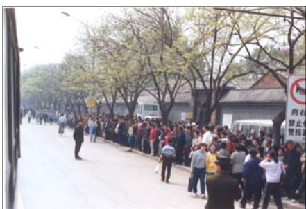
图：99年4月25日法轮功学员静静等待着向国务院信访办反映情况

1999年4月25日万名法轮功学员在中南海附近的府右街集体上访。同年7月20日中共发动了对法轮功学员迫害运动。许多人说：“如果没有发生上万人去北京，就不会导致中共镇压。”果真如此吗？