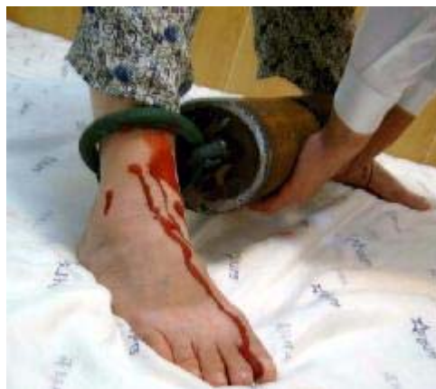
酷刑演示：几十斤重的脚镣