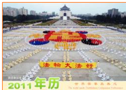
2011 年年历：世界需要真善忍

同事感慨的说：“我想做点善事，前些年我有一位亲戚找我为佛教捐款，说捐的越多功德越大。我捐了两千元。后来发现我捐的钱都变成了他的服装。我们农村老家的大队说是搞建设，谋