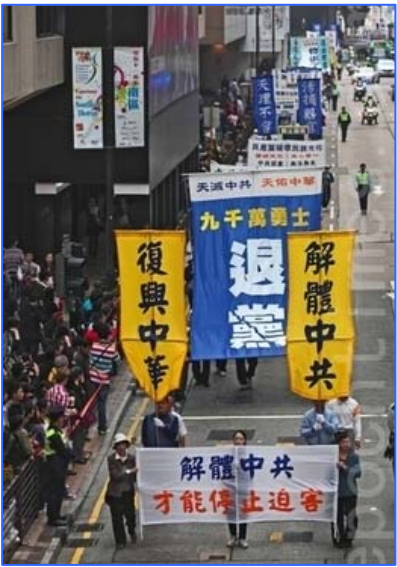
2011 年 3 月 6 日香港声援九千万中国同胞退出中共。