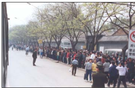
图：99年4月25日法轮功学员静静地等待着向国务院信访办反映情况。

我也跟着队伍沿府右街往南走，随后我又看见另一队警察带领着法轮功学员队伍从长安街方向过来，两边汇合后，警察就安排我们站在府右街马路的人行道上。我们自觉排成三排，留出了盲道、行人路和花池草地。因来了上万人，所以长安街、西四、西单、北海及胡同里都有法轮功学员。结果由警察指挥、安排成了对中南海包围之势。