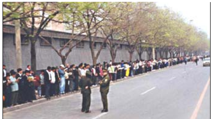
上图：因为天津公安非法抓捕 45 名法轮功学员，1999 年 4 月 25 日，法轮功学员依法到国务院信访办上访。他们文明安静，没有口号标语，没有影响交通。当时朱镕基总理接见学员代表，答应让天津方面放人，于是大家安静离去。

所以，就出现了四月二十五日全国万名法轮功学员到北京上访、要求放人的场面。其实，直到这时，法轮功学员还是本着相信政府的意愿去上访的，一切都是和平理性的，没有任何过激行为，但万万没有想到这次善意的上访，却成为独裁的当权者、政治小人江泽民利用手中权力迫害全国亿万法轮功学员的借口。