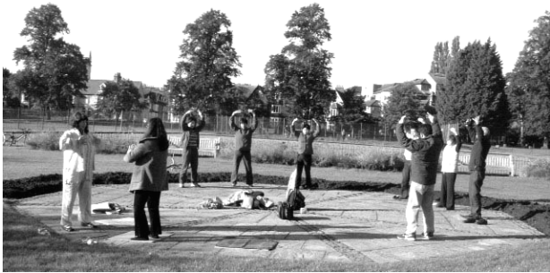
在剑桥大学公园里晨炼的法轮功学员