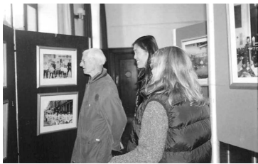
英国外交家昂西斯爵士观赏“正法之路”图片展

2001 年 11 月 26 日，剑桥行政区市政展览大厅举办法轮大法“正法之路”图片展，展览所揭示的真相令许多前来参观的西方人士和剑桥大学的中国留学生感动。年近九十岁的英国外交家、前英国驻爱尔兰大使福昂西斯爵士在展览开幕式的演说中说：“法轮功不仅是属于中国的，这是一项全球性的新文明精神运动，代表了