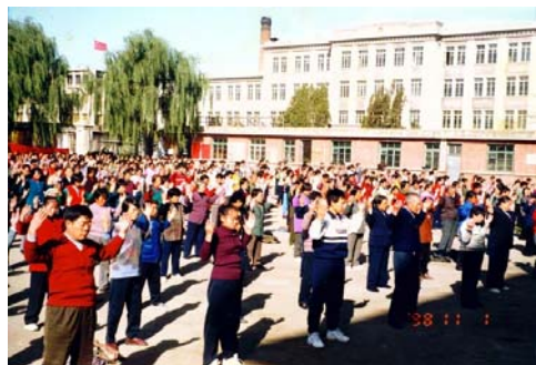
1998年法轮功学员在凌源市政府门前集体炼功的盛况。

了。上千人的队伍,跨越几个街口,神龙见首不见尾。游行队伍分为三部份:开篇是“大法洪传”,由天国乐团开路。雄壮的乐曲犹如千军万马响彻在法拉盛华人最热闹的缅街上空。接下来是“中原蒙难”,肃穆的法轮功学员捧着被迫害致死的同修的照片,叙述着法轮功学员不畏强权,坚守真理,惊天地泣鬼神的传奇。第三部份是“三退保平安”,各方民众退出中共党团队,为自己的生命开创着最美好的未来。◇