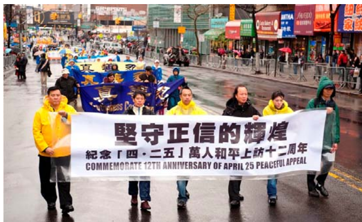
■ 纪念“四·二五”十二周年,法轮功学员在纽约法拉盛举行大游行。

了。上千人的队伍,跨越几个街口,神龙见首不见尾。游行队伍分为三部份:开篇是“大法洪传”,由天国乐团开路。雄壮的乐曲犹如千军万马响彻在法拉盛华人最热闹的缅街上空。接下来是“中原蒙难”,肃穆的法轮功学员捧着被迫害致死的同修的照片,叙述着法轮功学员不畏强权,坚守真理,惊天地泣鬼神的传奇。第三部份是“三退保平安”,各方民众退出中共党团队,为自己的生命开创着最美好的未来。◇