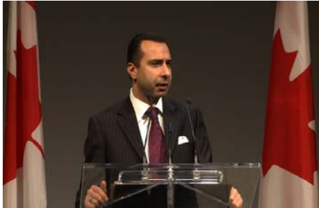
■沙菲在影片《自由战士》首演式上演讲

（明慧记者加拿大报道）二零一一年三月二十七日，“同一个自由世界”国际组织（One Free World International）在加拿大多伦多举行纪录片《自由战士》（Freedom Fighter）首演式。影片展示了宗教信仰在世界上受到迫害的情况，其中包括了仍在中国发生的针对法轮功的迫害。当天有数千人分两场观看了这部纪录片。