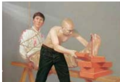
酷刑演示: 老虎凳(绘画)

在我的记忆里, 爸爸是最能吃苦的。在小的时候, 爸爸妈妈做收购废品生意, 因为爸爸按照真善忍行事, 勤劳吃苦, 诚实守信, 所以生意越来越红火。在家里无论妈妈怎么发脾气, 爸爸都会乐呵呵的忍让过去, 再给妈妈讲道理, 坏脾气的妈妈每次都会被爸爸说的心服口服。在爸爸的感染下, 妈妈也开始修炼法轮功, 而且变得非常孝顺爷爷和奶奶。那时我们一家其乐融融, 全家都沐浴在