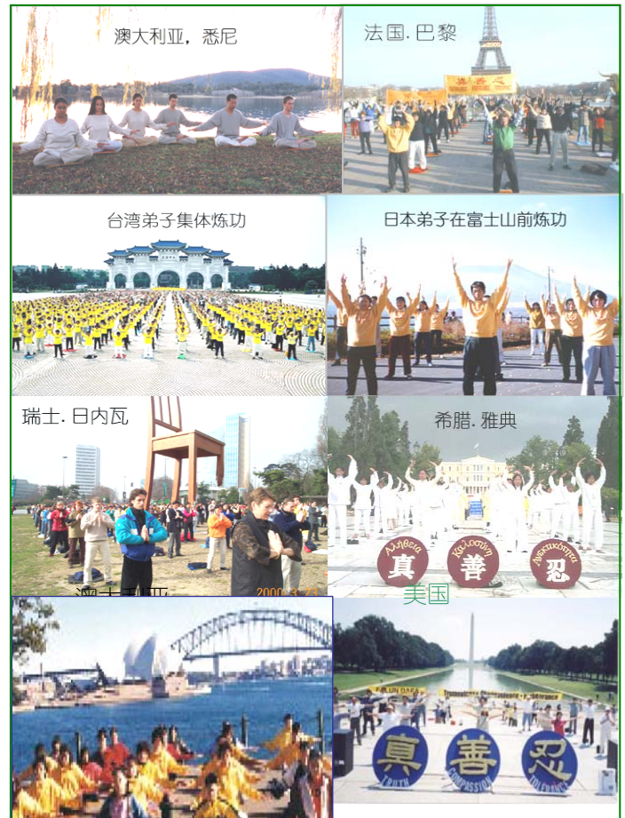
世界各地法轮功学员集体炼功图片集锦