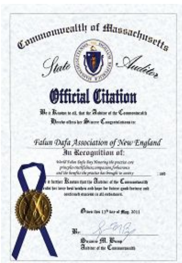
麻州审计厅厅长苏珊·班彭 (Suzanne Bump) 褒奖令