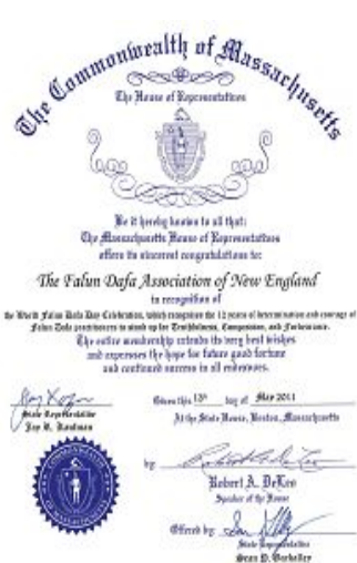
麻州众议员希恩·戈巴利 (Sean Garballey) 颁发的褒奖令

法轮大法自 1992 年 5 月 13 日从中国大陆传出，至今已弘传世界一百多个国家和地区，获各国政府机构褒奖及支持议案、支持信函 3000 多项。《转法轮》被译为近 30 种文字在全世界出版发行。◇