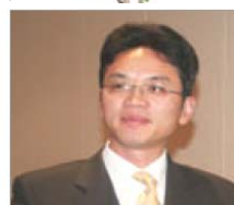
前驻悉尼外交官 陈用林