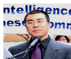
前国安部对外 情报官 李凤智