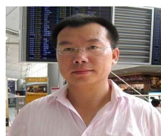
前人民日报 人民论坛副主任 邱明伟