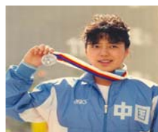
前奥运游泳名将 黄晓敏