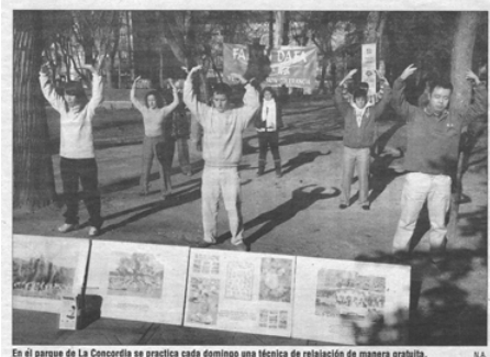
图：瓦德拉哈勒最大报纸《Nueva Alcarria》对法轮功炼功点的报道图片

西班牙瓦德拉哈勒市的法轮功学员日复一日地在当地公园里教民众学炼法轮功功法，深受市民喜爱，当地最大的报纸《Nueva Alcarria》前来采访，并以大篇幅进行了报道。