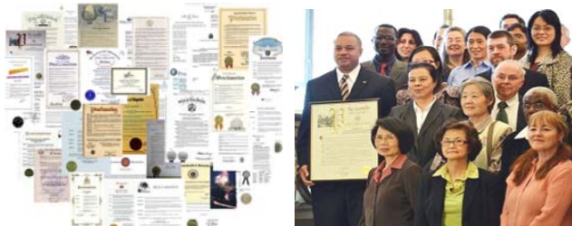
左图：2011 年 4 至 5 月，美国、加拿大多个州、市褒奖法轮大法（图为部分褒奖状）

近日，美国、加拿大许多地方政府褒奖法轮大法、褒奖法轮大法创始人李洪志先生，宣布“法轮大法日”，称赞法轮大法超越种族和文化界限，带给不同社会阶层的人健康高尚的生活，褒奖包括：美国科罗拉多州州长签署褒奖令宣布 2011 年 5 月 13 日为科州“法轮大法日”；纽约州参议院通过立法决议宣布 2011 年 5 月为“世界法轮大法月”；麻州众议员、审计厅厅长、昆西市市长分别颁发褒奖令，祝贺世界法轮大法日，称赞法轮大法修炼者十二年来维护“真、善、忍”的坚定和勇气，等等。