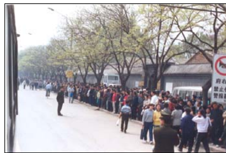
图：九九年四月二十五日法轮功学员静静等待向国务院信访办反映情况

一九九九年四月二十五日逾万名法轮功修炼者到位于北京中南海附近的府右街信访办上访，引起举世震动。四·二五上访是法轮功学员平和理性地在中共暴政面前坚持自己做好人的权利。经历了十二年的岁月，人们愈发清楚地看到四·二五所展现的善良和坚忍，因为这善良和坚忍一