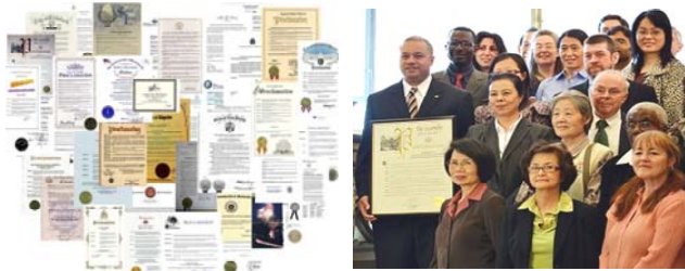
左图：2011 年 4 至 5 月，美国、加拿大多个州、市褒奖法轮大法（图为部分褒奖状）

近日，美国、加拿大许多地方政府褒奖法轮大法、褒奖法轮大法创始人李洪志先生，宣布“法轮大法日”，称赞法轮大法超越种族和文化界限，带给不同社会阶层的人健康高尚的生活，褒奖包括：美国科罗拉多州州长签署褒奖令宣布 2011 年 5 月 13 日为科州“法轮大法日”；纽约州参议院通过立法决议宣布 2011 年 5 月为“世界法轮大法月”；麻州众议员、审计厅厅长、昆西市市长分别颁发褒奖令，祝贺世界法轮大法日，称赞法轮大法修炼者十二年来维护“真、善、忍”的坚定和勇气，等等。