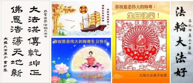
图：大法传世十九周年前夕，中国大陆各行业的法轮功学员突破中共的网络封锁，在明慧网上发表上万份贺卡、贺词，表达对李洪志师父的感恩和对修炼的坚定。