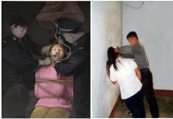
酷刑演示: 左图/鼻饲灌食 右图/抓住头发撞墙