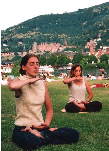
图:德国姐妹炼法轮功第五套功法

近年来,很多研究都显示静坐对健康的益处。其实这一点早已被广大法轮功修炼者证实。当然,真正达到这一点,只通过打坐是不够的,更主要的是要提高自己的心性,指导法轮功学员提高心性的是李洪志先生的《转法轮》等著作。