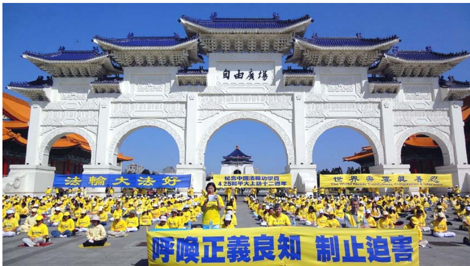
图：台北法轮功学员举办活动，纪念“四二五和平大上访十二周年”。

到现在我一粒药没吃过，以前每年四、五千药费，农民药费没地方报销，全是自己负担。修大法既祛病又减轻了经济负担，生活得有滋有味很乐观，大法使我绝处逢生，是师尊给了我新生。我发自内心的感恩师尊的佛恩浩荡。（文／河北农村大法弟子）