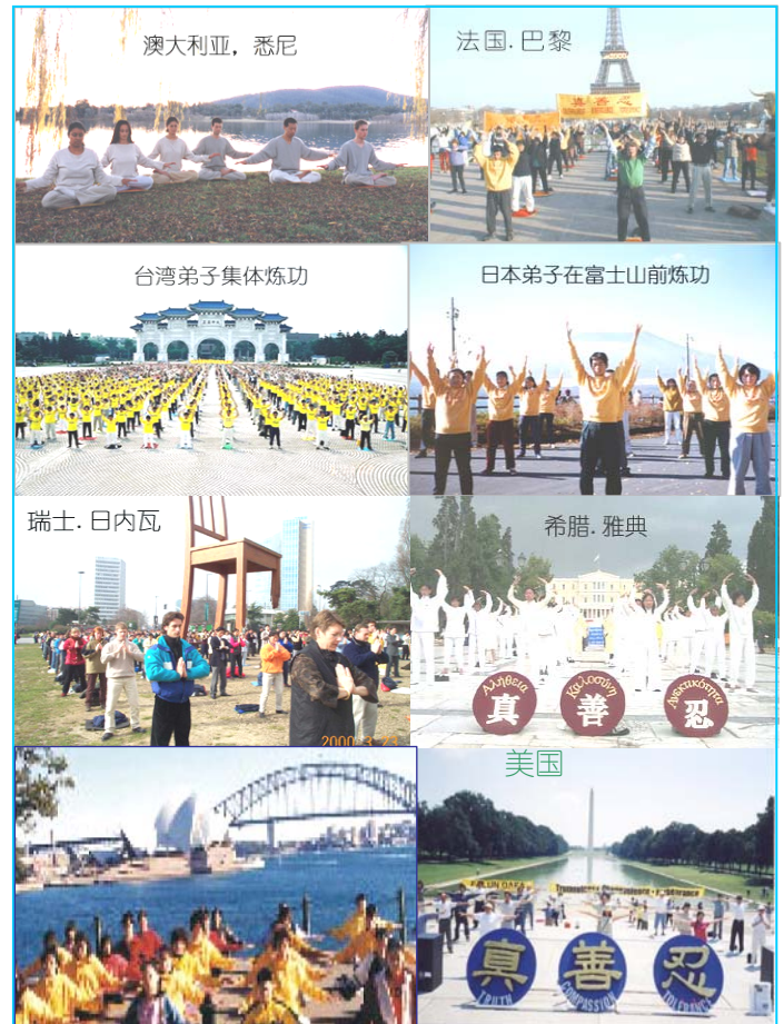
世界各地法轮功学员集体炼功图片集锦