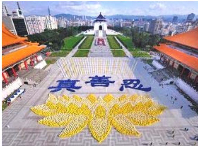
二零一零年十一月二十七日，五千多名法轮功学员在台湾中正纪念堂排出莲花图形和“真善忍”三大字。

法轮功是佛家修炼大法，以真、善、忍为修炼原则。修炼人从做好人做起，努力按照真、善、忍标准提升个人心性，返本归真；还包含五套缓慢优美的功法动作。法轮大法教人向善。修炼法轮功不但能祛病健身，使人变得诚实、善良、宽容、和平，而且能开启智慧，逐渐达到洞悉人生和宇宙奥秘的自在境界。