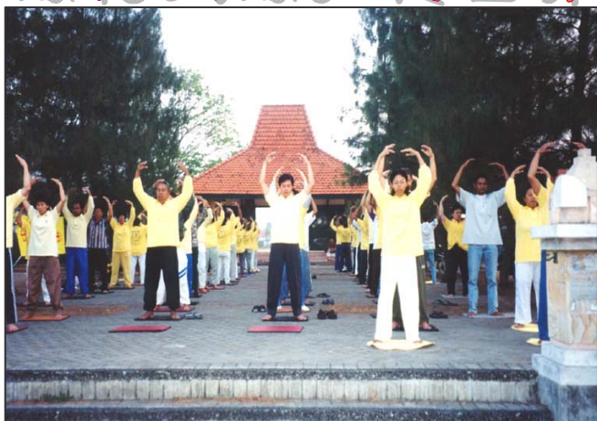
上图是印尼法轮功学员在公园集体炼功

在法轮功传世 19 年之后，特别是在法轮功经历了中共恶党 11 年的疯狂迫害之后，世人惊奇的发现——法轮功不仅没有倒下，反而迅速传遍全球。对于经历过中共无数次政治运动的中国人来讲，这是一个值得深思的奇特现实。