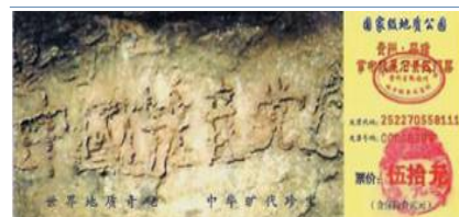
图:2002 年 6 月在贵州境内发现了 2.7 亿岁的“藏字石”,五百年前崩裂的巨石断面内惊现六个排列整齐的大字“中国共产党亡”。天灭中共实乃天意,“三退保命”绝非戏言。

今生今世,我都无法报答法轮大法及李洪志师父对我的大恩大德,我要用法轮功赐予我的生命,向世上所有的人证实一个亘古不变的天理:法轮功好!法轮大法好! ◇