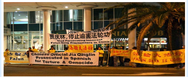
图：法轮功学员在珀斯喜来登酒店对面抗议贾庆林迫害法轮功

贾庆林是被“追查迫害法轮功国际组织”追查的十一个直接参与推动对法轮功学员迫害的中共中央官员之一，也是西班牙国家法庭以“群体灭绝罪”及“酷刑罪”起诉的五名迫害法轮功的元凶之一。