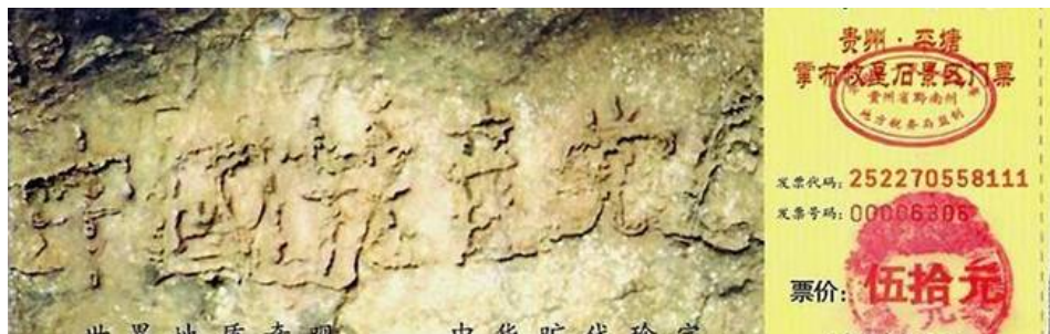
图:贵州省平塘县掌布乡“藏字石”风景区门票正面图案,显示“中国共产 党亡”。据新纪元周刊分析,藏字石上“中国共产党亡”六个字,其中“国”、 “产”都是正体字,而“党”则是简体字。就是改造汉字为简体的那个“党”。 也就有所暗示,“国产”是正统老字有根不亡,亡党在即,亡党不亡国也。

这位前“书记”接着说,我给儿子“三退”后,还帮他调离了海南省武 警部队,到地方工作了。这个部队不是维持和平的,自零八年以来,多次镇 压海南少数民族的抗暴活动,打死了好多无辜民众,武警战士也死了不少, 中共将事实压下,外界根本不知道,我不能叫儿子作炮灰。我上恶党贼船将 近四十年,狂风恶浪什么不清楚,它最阴毒的杀手铜就是“卸磨杀驴”,我 要给自己留一条后路。◇