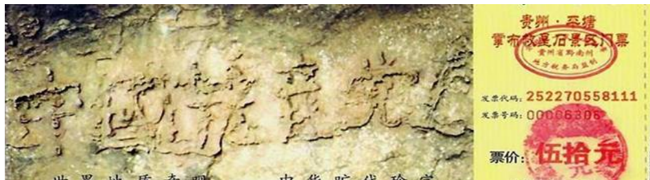
图:贵州省平塘县掌布乡“藏字石”风景区门票正面图案,显示“中国共产党亡”。专家鉴定,500年前一块2.7亿年的巨石从崖壁落下,落地一分为二。2002年6月裂开的石头断面被当地人发现有一行汉字,这些汉字经三批国内专家鉴定,其结论为天然形成。而石头上清晰可见的六个字是:中国共产党亡(国内媒体隐去了亡字)。

劫后余生,即使有人不信神,经历这样的事,也总会感到冥冥之中有一种力量在操纵着这一切。也许有的人命中本有劫数,但因为自己对大法的善念、并退出了迫害大法的中共,这样的人能躲过劫难,上天看护着善人。◇