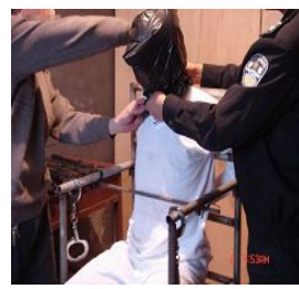
酷刑演示：用塑料袋套头，使人窒息