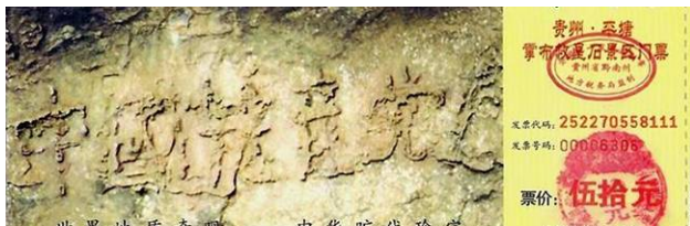
图: 贵州省平塘县掌布乡“藏字石”风景区门票, 显示“中国共产党亡”, 六个天然大字。

(接上页) 慢慢的我能给家人做饭了, 也能伺候瘫痪的公公和照顾孩子了。法轮大法这超常的科学治好了我的病, 慈悲的师父给了我第二次生命。