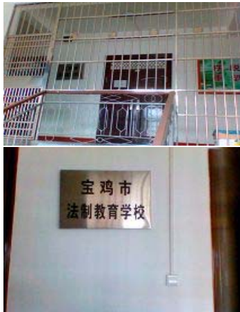
左图：三楼楼口整个都被不锈钢管封闭着，走廊墙上挂的对外牌子谎称“宝鸡市政法教育学校”。

洗脑班是二零一零年九月份宝鸡市政法委、六一零在陕西省六一零办公室的授意和直接参与下成立的。九月份刚成立时，这里就非法关押着宝鸡市岐山县、眉县、陈仓区、宝鸡市区等多名法轮功学员。宝鸡市政法委、六一零强迫每个被绑架到这个黑窝的法轮功学员所在地派出所(或街