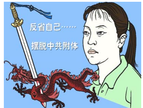
图：反省自己摆脱中共附体

这个局长经常说：“我过去在无知中造了不少业，遭了不少恶报。现在我知道了大法的法理，认清了共产党的邪恶本质，我不但不作恶了，我还要为大法做好事得福报，我也要美好的未来。”