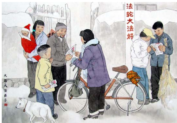
绘画：《历尽千辛传真相 大法福音救世人》

妈妈找了一份售货员的工作。她炼功前一向脾气不好，常与顾客吵架。自从修炼大法后，妈妈知道炼功人得同化“真善忍”，现在她对顾客特别有耐心，即使是面对很挑剔的顾客，她也会很耐心，为别人着想，提供更好的服务。她因此得到了很多人的好评。◇