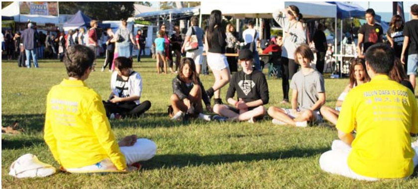
图：一群年轻人向法轮功学员学习功法

（明慧记者布里斯本报道）法轮功是什么？为何全球有这么多人修炼？哪里有炼功点？二零一一年六月四日，澳洲布里斯本北区惹米尔多元文化节庆典上，许多人都在问着相同的问题。