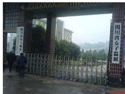
简阳市养马镇四川女子监狱

(明慧网通讯员四川报道)下面是部份在四川省简阳养马镇女子监狱被非法关押的法轮功学员的简况。