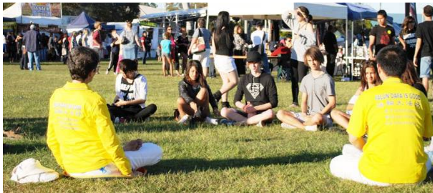
图：一群年轻人向法轮功学员学习功法

（明慧记者布里斯本报道）法轮功是什么？为何全球有这么多人修炼？哪里有炼功点？二零一一年六月四日，澳洲布里斯本北区惹米尔多元文化节庆典上，许多人都在问着相同的问题。