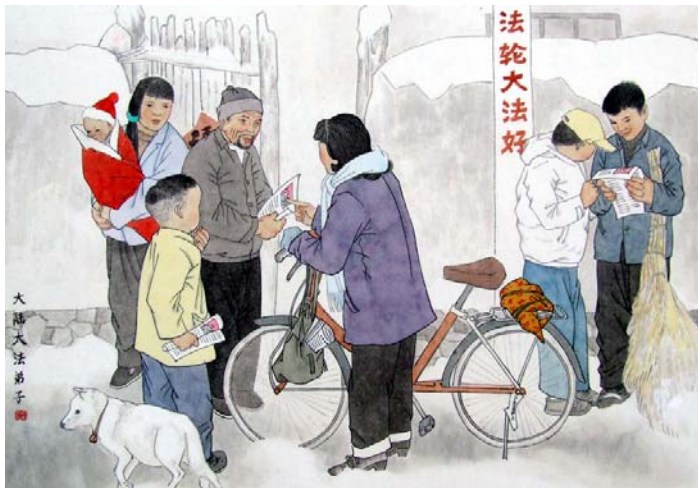
绘画：《历尽千辛传真相 大法福音救世人》

妈妈找了一份售货员的工作。她炼功前一向脾气不好，常与顾客吵架。自从修炼大法后，妈妈知道炼功人得同化“真善忍”，现在她对顾客特别有耐心，即使是面对很挑剔的顾客，她也会很耐心，为别人着想，提供更好的服务。她因此得到了很多人的好评。◇