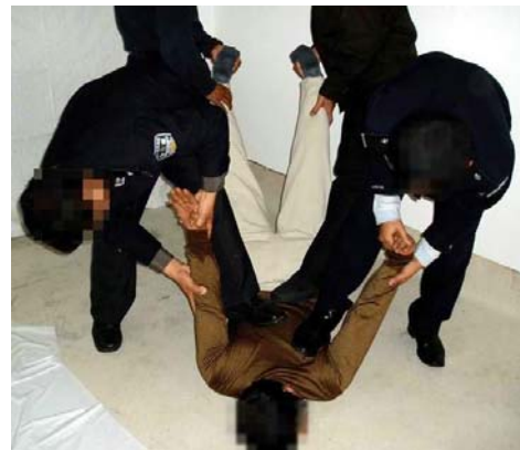
酷刑演示：暴力殴打