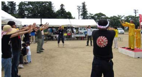
图：民众现场学炼法轮功