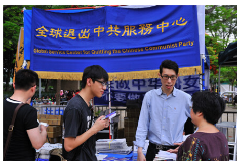
图：在香港维多利亚公园的退党服务中心，正在听法轮功真相的市民。