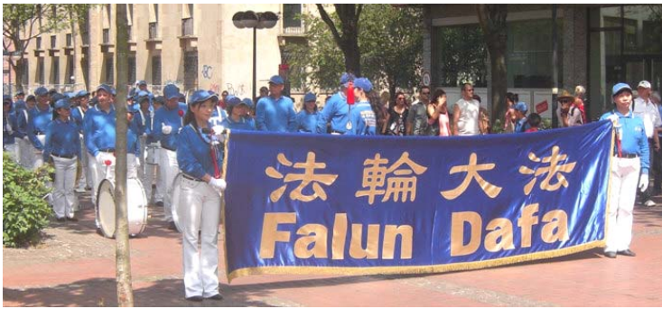
图：参加游行和集会的欧洲天国乐团。

【明慧网】二零一一年六月四日，欧洲天国乐团应邀参加了在多特蒙德市的游行和集会，这支由欧洲十个国家的法轮功学员组成的乐团，为这足球之乡带来了不同凡响的音乐。