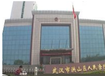
武汉市洪山区法院