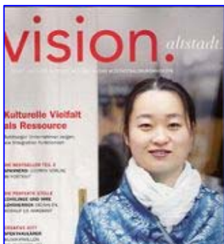
《老城视觉》杂志以法轮功学员作为封面人物

的官方机构（注：610 非法组织，类似纳粹盖世太保）。而法轮功只不过是一种祥和的修炼方式，是以“真、善、忍”为原则的修炼方法。