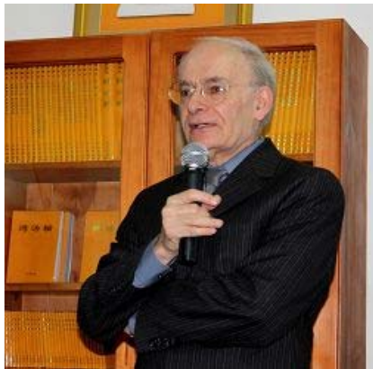
著名人权律师大卫·麦塔斯