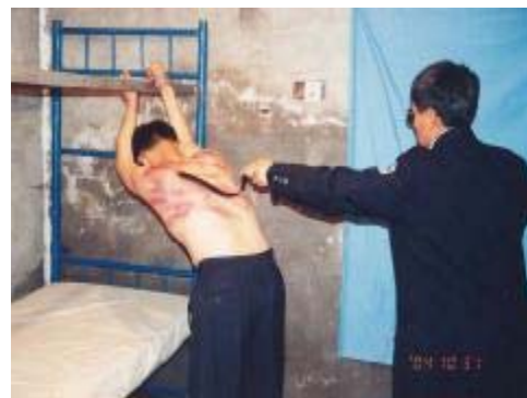
酷刑演示:吊铐毒打

在此,我们正告那些还在参与迫害法轮功学员的警察们:你们所执行的所有迫害法轮功的密令都是违法违宪的,你们所干的每一件伤天害理的事情都被记录在案,当历史走过这一页时,你们都难逃法网。◇