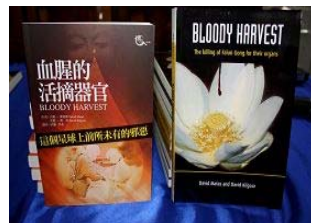
《血腥的活摘器官》 中文版和英文版

他说：“独裁政权其实是非常脆弱的，只要你坚持努力，它最后就会分裂和瓦解。它的消失往往是突然的和不可预测的。这样的结果会在中国发生，对法轮功的迫害最终将被制止。”◇