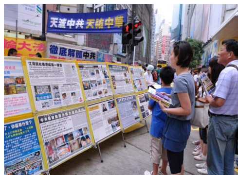
图：在香港维多利亚公园附近的真相展板点，许多大陆游客手拿着《九评共产党》书、法轮功真相资料驻足认真观看真相展板上的法轮功真相。

【明慧网】二零一一年三月六日香港举行了声援九千万中国勇士退出中共邪党的集会大游行。到六月下旬，“三退”（退出中共党、团、队）人数已经超过了九千七百万。设立在香港旅游景点的退党服务中心，已成为景点中一道特别的风景线，大陆游客在这里看到了国内极力封锁的真相，许多大陆游客明白了真相，纷纷选择“三退”。朋友，您退了吗？快快退吧，天要灭中共邪党，快三退自救。◇