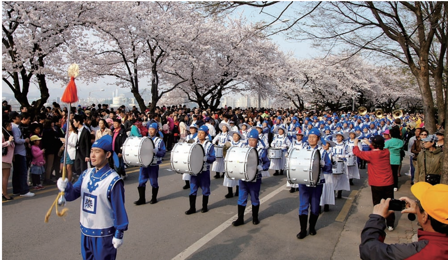
应邀参加表演的、由法轮功学员组成的天国乐团成了这次庆典的亮点，他们的表演赢得了游客们热烈的掌声和叫好声。

很多中国大陆游客看到了天国乐团和法轮功功法表演后，脸上露出震惊的表情，不少人主动跟发传单的法轮功学员要真相传单，也有不少人拿出相机拍照留念，还有的在天国乐团演奏休息期间，与乐团成员合影留念。