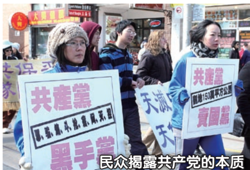
民众揭露共产党的本质