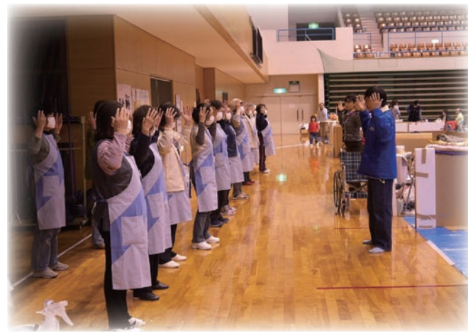
避难所工作人员向法轮功学员学习“法轮桩法”