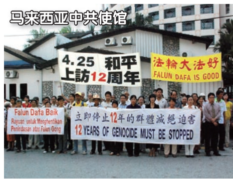
马来西亚中共使馆