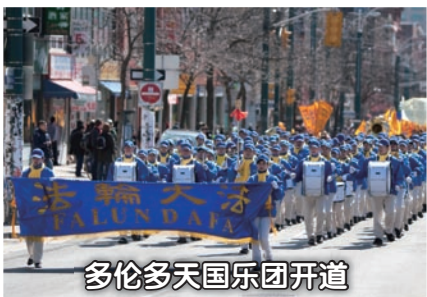
多伦多天国乐团开道

2011年3月19日，加拿大多伦多各界人士在靠近唐人街的Grange Park举行了声援九千一百万人退出中共相关组织的集会及大游行。活动受到各界华人和其他族裔团体的支持。来自华人社区、南亚社区及越南社区的团体代表及个人约十人在集会现场作了发言，揭露中共的邪恶本质及其迫害中国人民的事实，还有现场办理三退（退出中共党、团、队）服务。