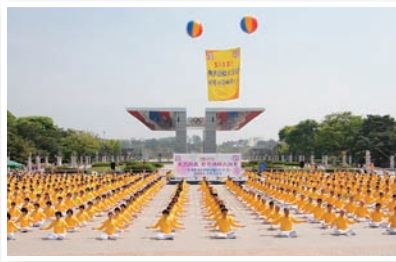
P9 韩国民众欢庆法轮大法日