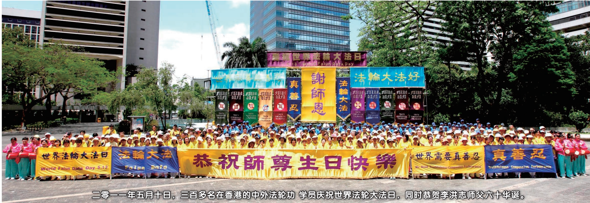
二零一一年五月十日，三百多名在香港的中外法轮功学员庆祝世界法轮大法日，同时恭贺李洪志师父六十华诞。

2011年5月13日是第十二届世界法轮大法日，也是李洪志先生六十华诞。在普天同庆的佳节即将来临之际，世界各地法轮功学员举行庆祝活