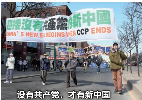
没有共产党，才有新中国

集会之后沿着唐人街举行了盛大的游行，天国乐团洪亮庄严的音乐，以及有各种巨大横幅和旗帜的队伍，赢得了沿途观众的称赞。