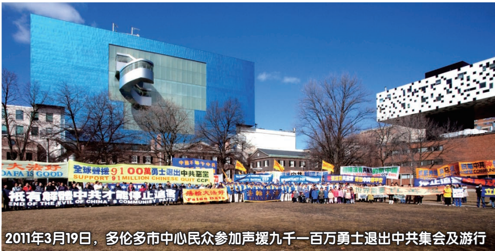
2011年3月19日，多伦多市中心民众参加声援九千一百万勇士退出中共集会及游行