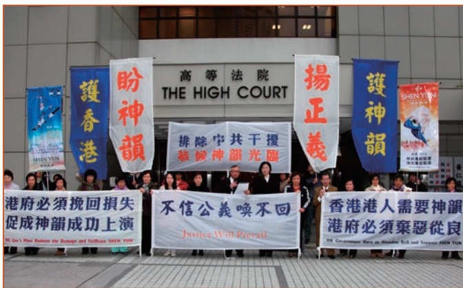
■主办方在香港高等法院外集会，呼吁各界伸张正义，支持神韵艺术团来港演出。

香港入境处拒签美国神韵艺术团六名团员的司法复核案，高等法院2011年3月9日正式判决撤销入境处的拒签决定。