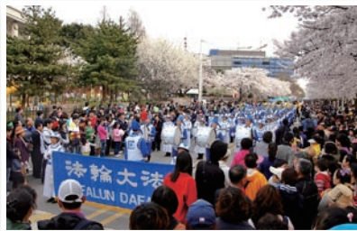
P29 韩樱花节 天国乐团成亮点