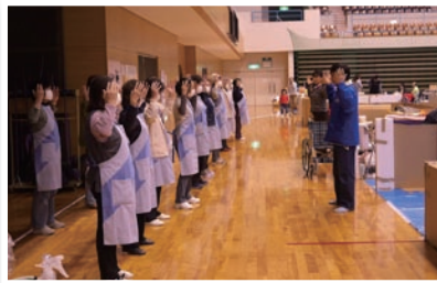
P17 炼功音乐在日避难所回响