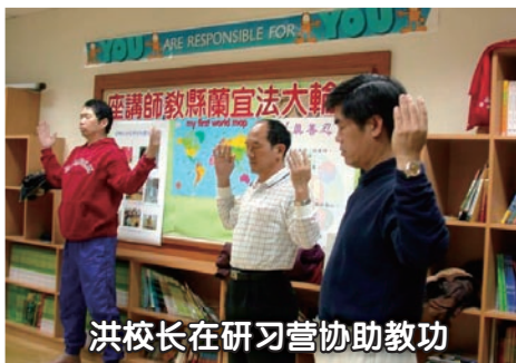
洪校长在研习营协助教功