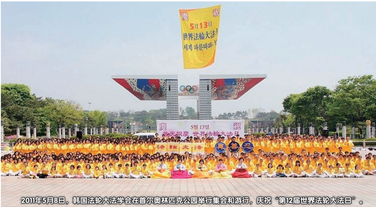
2011年5月8日，韩国法轮大法学会在首尔奥林匹克公园举行集会和游行，庆祝“第12届世界法轮大法日”。

2011年5月13日是“第十二届世界法轮大法日”，韩国各界的庆祝活动于5月8日上午在韩国首尔奥林匹克公园和平门广场举行，来自韩国各地的数百名法轮功学员演示五套功法后，韩国各界知名人士在庆祝会上发表演讲。随后法轮功学员举行了演出，演出结束后，庆