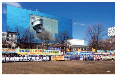
P15 多伦多声援退党集会游行