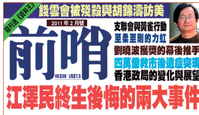
■香港《前哨》杂志封面

香港《前哨》杂志2011年2月刊载文章《江泽民终生后悔的两大事件》。作者揭示，2010年起江泽民至少两次对身边的人谈到，这一辈子做过两件愚蠢之事：蠢事之一是美国轰炸南斯拉夫时，下令中国大使馆不能撤退；蠢事之二则是江泽民迫害法轮功，为自己平添了几千万“敌人”。