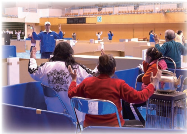
法轮功学员教授功法，市民学得很认真