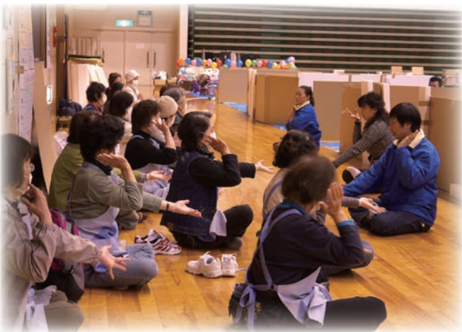
须贺川市避难所，义务教授法轮功五套功法

据不完全统计，截至4月18日为止，超过一百人次的在日华人法轮功学员分别前往仙台市、石卷市、气仙沼市、东松岛市、福岛市等受灾地的几十个避难所，向灾区的人们教授法轮功。这些灾区有的曾被海啸完全吞没，有的因为核辐射原因而较少有义工服务，然而这里的避难所，却在近几周内经常看到法轮功学员的身影。