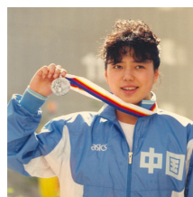
前奥运游泳名将 黄晓敏