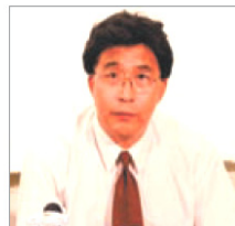
前沈阳市司法局局长 韩广生