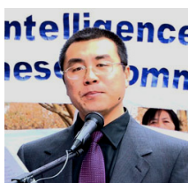
前国安部对外情报官 李凤智