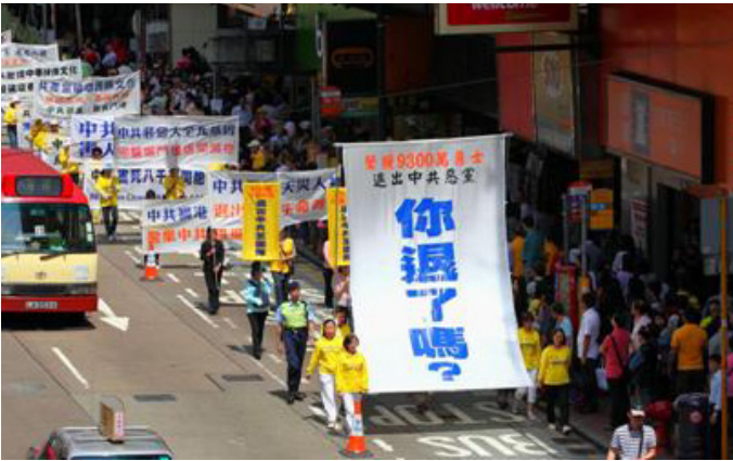
图：2011 年 4 月 24 日，香港声援 9300 万退党大潮。

目前中国大陆的社会表面变化形势并不剧烈，但却在一点点的稳步的向前推进，每过一段时间就可能爆发一些预料不到的事件，但件件都对中共不利，情况越来越向正义的一方倾斜，而中共已无力扭转局面，也许将来出现的某个突发性事件就断送了中共的命运，就如同苏联东欧剧变一样叫人难以预料。现在社会表象的模糊不清与扑朔迷离，考验着每个人的智慧与悟性。如何选择，决定了每个人的未来。