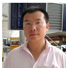
前人民日报副主任 邱明伟